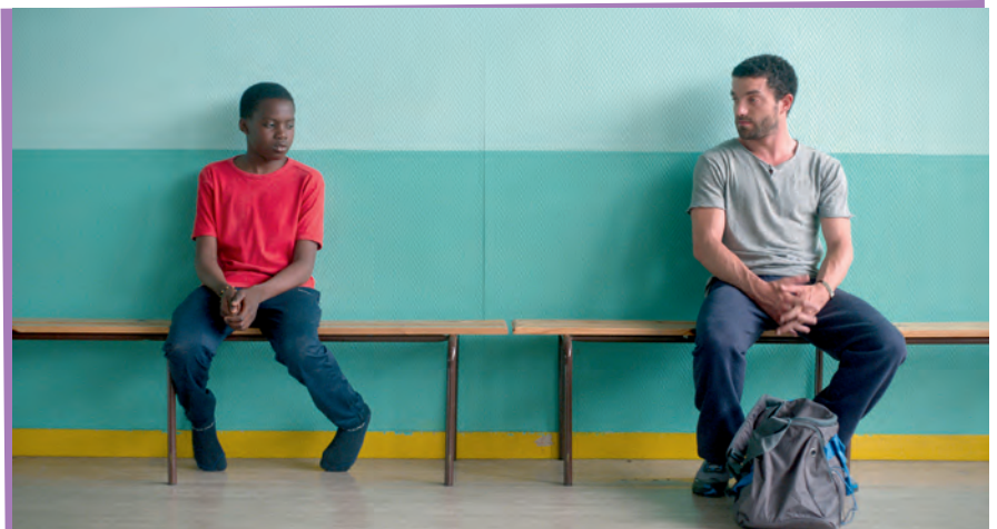
La vie en grand , film de Mathieu Vadepied (1h 33 min) avec Balamine Guirassy, Ali Bidanessy et Guillaume Gouix