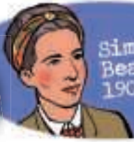
Simone de Beauvoir 1908-1986