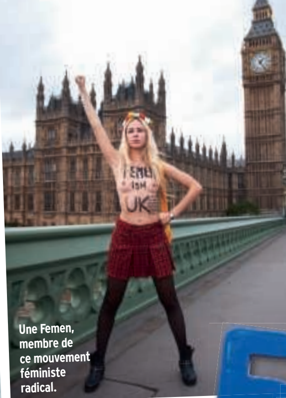
Une Femen, membre de ce mouvement féministe radical.

Cette phrase de Simone de Beauvoir est extraite du Deuxième sexe , qui fit scandale à sa parution, en 1949 ! Avec ce livre, la philosophe signait un texte essentiel pour le féminisme.