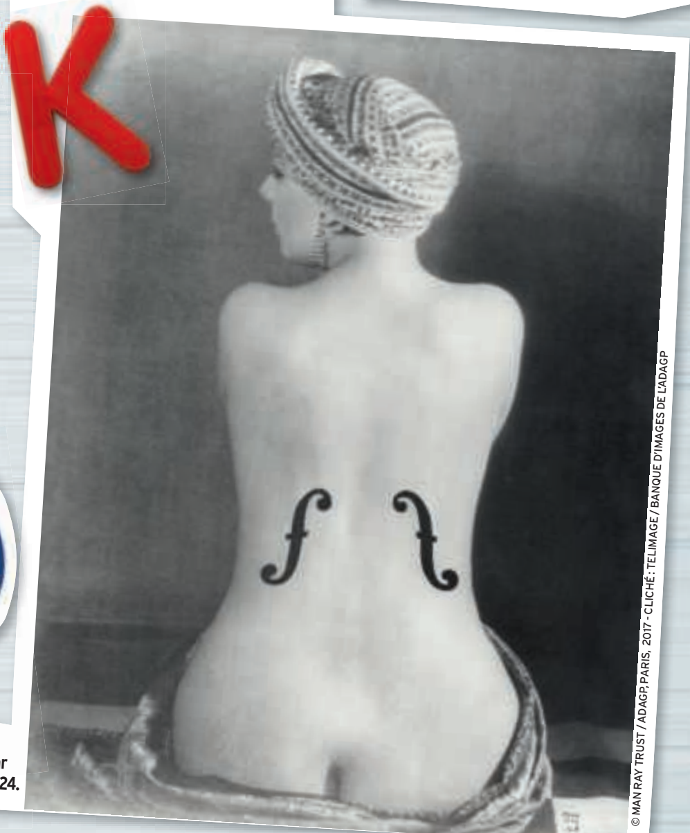
© MAN RAY TRUST / ADAGP, PARIS, 2017 - CLICHÉ : TELIMAGE / BANQUE D'IMAGES DE L'ADAGP