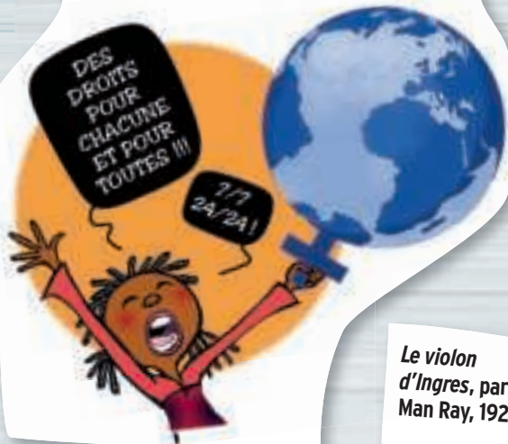
Le violon d'Ingres, par Man Ray, 1924.

Instituée par l'ONU en 1977, il y a donc 40 ans, le 8 mars est la Journée internationale des droits des femmes. Et non la journée de la femme ! Cela signifierait, en effet, que les 364 autres jours de l'année sont dédiés aux hommes... Cette journée spéciale appelle à une prise de conscience de la condition féminine partout dans le monde.