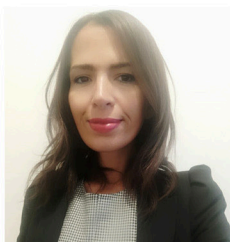
Esma L'Hocine Sixi me Suppl ante