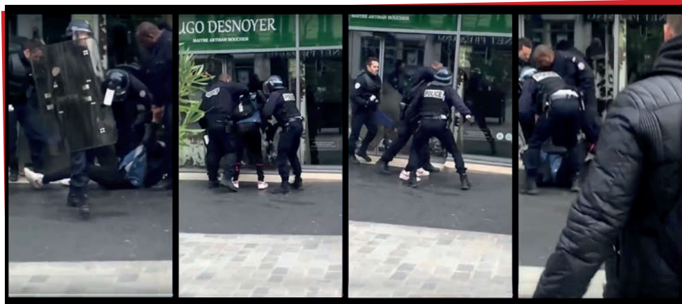
Violences policières lors de la manifestation du 24 mars 2016

adulte, si, en dépit de leurs droits fondamentaux dont celui de la liberté de penser et d'expression, en dépit de leur volonté de s'investir, de s'inviter dans le débat citoyen, les adultes leur dénie ce droit.