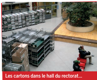
Les cartons dans le hall du rectorat...

Les Cden interminables en sous-sol, pour discuter des fermetures et des ouvertures de classe, c'est terminé. Les longues files d'attente pour les inscriptions en 6 e ou 2 nd e, c'est terminé. Les jeunes qui, en août, cherchaient désespérément un lycée professionnel pour les accueillir, c'est terminé. Les commissions diverses et réunions multiples souvent inutiles, c'est terminé. Les actions de parents d'élèves devant l'Académie où l'on pouvait barrer la route et couper la circulation, c'est terminé. Les listes des délégations pour inverser la courbe des fermetures, c'est terminé. Les séquestrations d'inspecteurs d'Académie, c'est terminé. Bref, l'Académie déménage. Les locaux de rue Gambetta vont être recyclés et certainement détruits pour céder la place à un centre commercial ou à un hôtel. Direction Porte de Pantin. Pas sûr que l'on gagne au change. ■