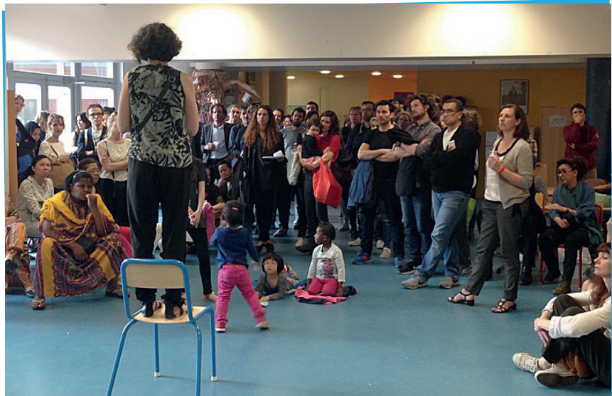
La Nuit des écoles à l'École Lancry, Paris 10 e

Sur cette problématique, dès l'an dernier, la Fcpe-Paris anticipait une situation explosive, qui s'est confirmée, selon le pire des scénarios. Les