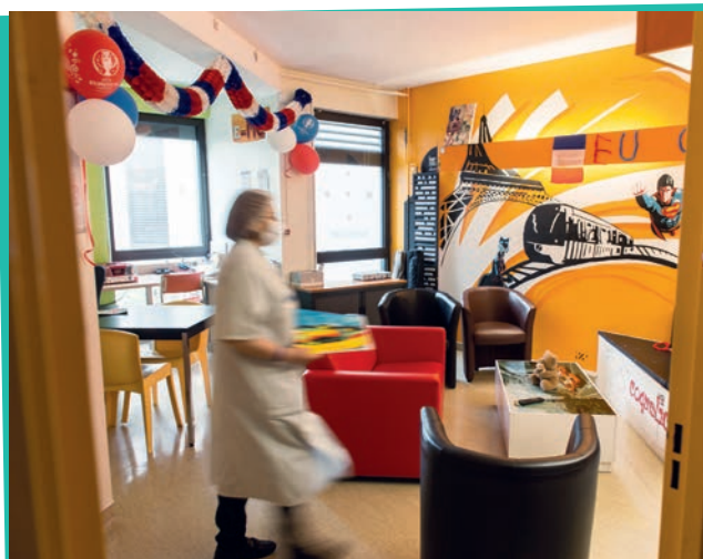
1. Mission académique pour la scolarisation des élèves en situation de handicap