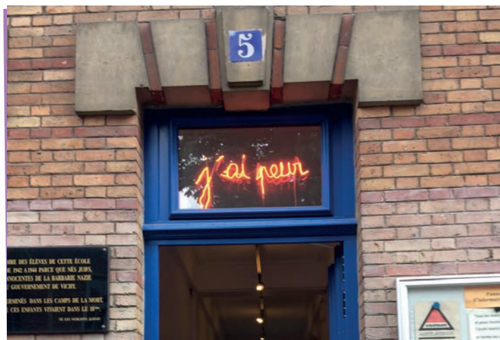
Du passage de Claude Lévêque, il reste un livre et un néon qui surplombe la porte d'entrée : « J'ai peur ». Des touristes viendraient le photographier !